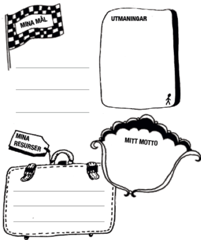
Mina mål, mina utmaningar och mina resurser