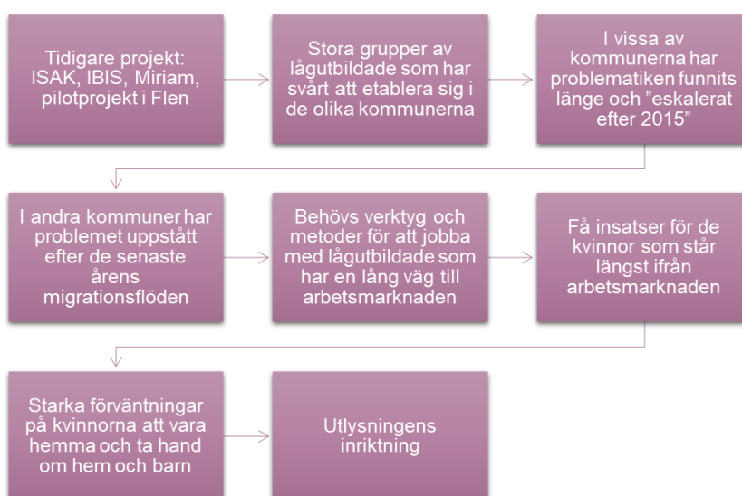
Tabell 2. Bakgrunden till projektet Klara.

Projektet drivs med bakgrund i lärdomar som gjorts i tidigare insatser. Behovsanalysen har skett utifrån tidigare projekt samt i verksamheter såsom sfi – där målgruppen tenderar att ha en långsam progression – samt i kommunernas individ- och familjeomsorgs förvaltning (eller motsvarande). Projektdeltagarna har genom projektet hämtats ur den grupp som befinner sig i försörjningsstöd och som har identifierats av socialtjänsten. För att illustrera framväxten av projektet Klara återanvänder Sweco här den bild som togs fram i nulägesanalysen och som även användes i halvtidsutvärderingen: